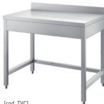
(cod. TVC) Tavolo con cornice. Table with frame. Table à rebords. Tisch mit Rahmen.