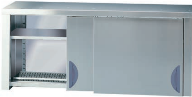
[cod. PP] Armadietto pensile scolapiatti. Overhead draining cupboard. Placard égouttoir. Hängeschrank Abtropfständer.