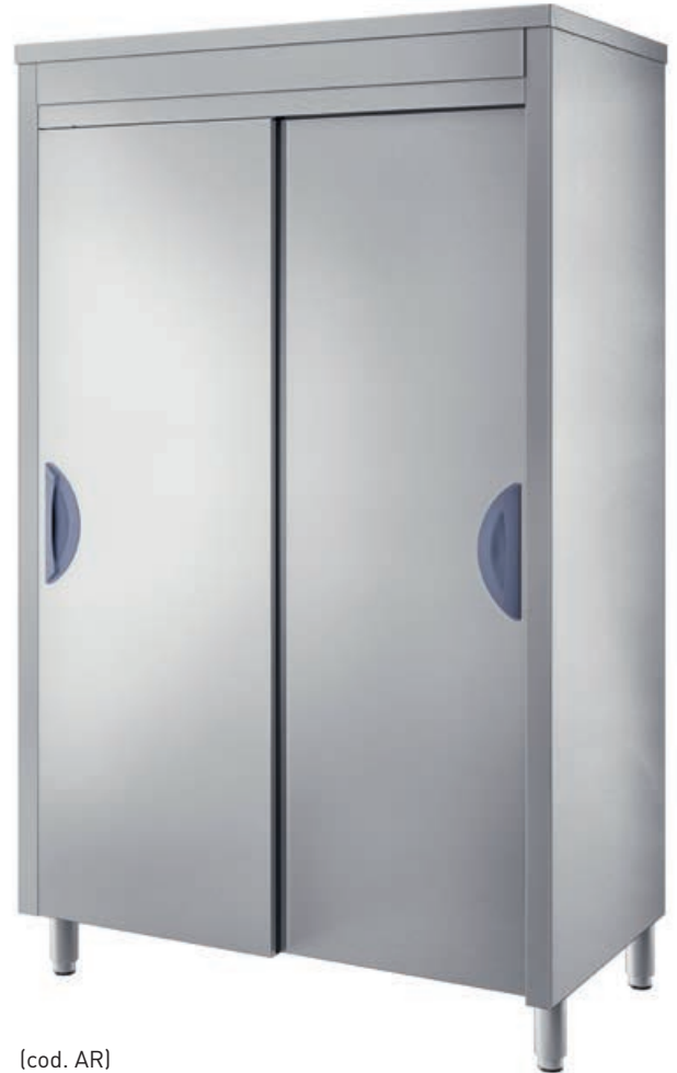
[cod. AR] Armadio di riposto. Storage cupboard. Armoire d'office. Ablageschrank.