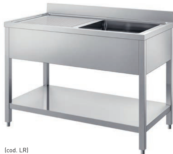
(cod. LR) Lavatoio con ripiano. Sink unit with shelf. Plonge avec étagère. Spüle mit Rahmen.