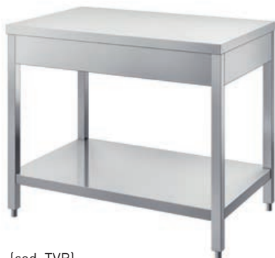
(cod. TVR) Tavolo con ripiano. Table with shelf. Table avec étagère. Tisch mit Ablagefläche.

Open front tables Les tables Arbeitstische