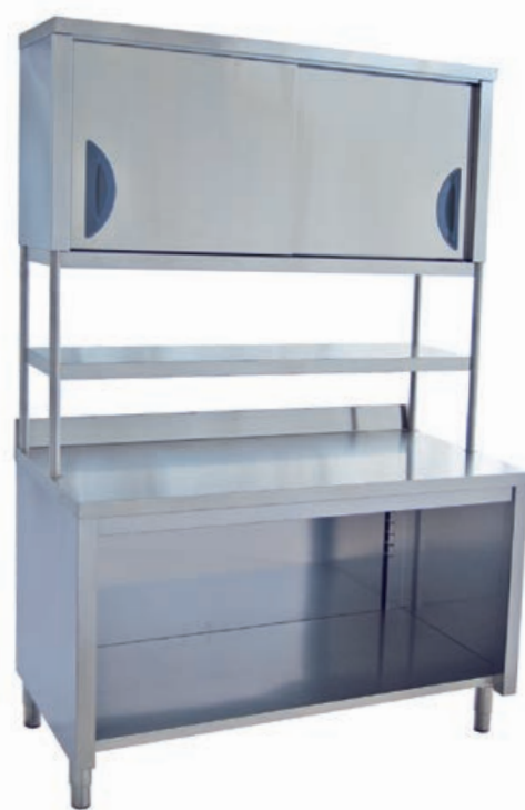
Tavolo armadiato a giorno (cod. TVS) con ripiani d'appoggio. (cod. RP) Open cupboard table with worktops. Table armoire ouverte avec étagères posées. Tisch mit Unterschrank, offen, und mit Ablageflächen.

REALIZZABILI SU MISURA! CAN BE MADE TO MEASURE! FABRICATION SUR MESURE POSSIBLE AUSFÜHRUNGEN NACH MASS!