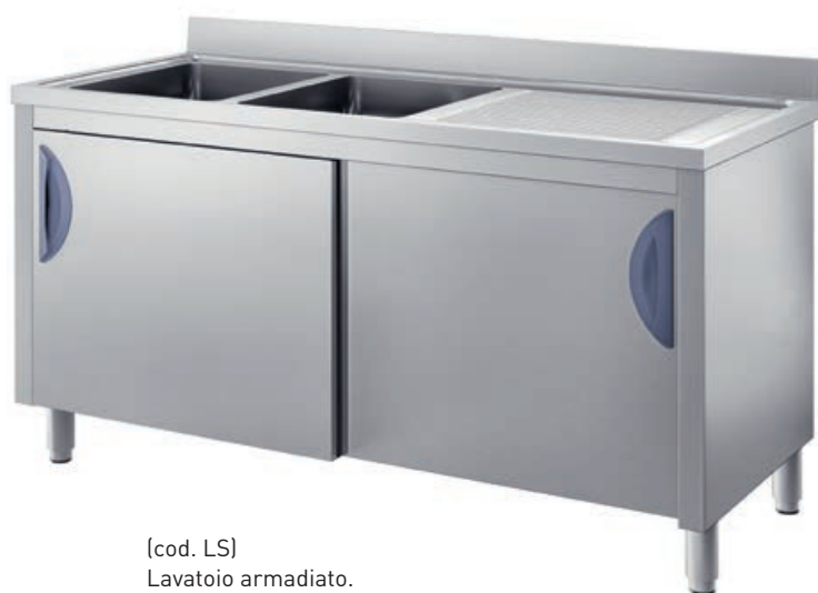
(cod. LS) Lavatoio armadiato. Sink cupboard. Meuble plonge. Spüle mit Unterschrank.