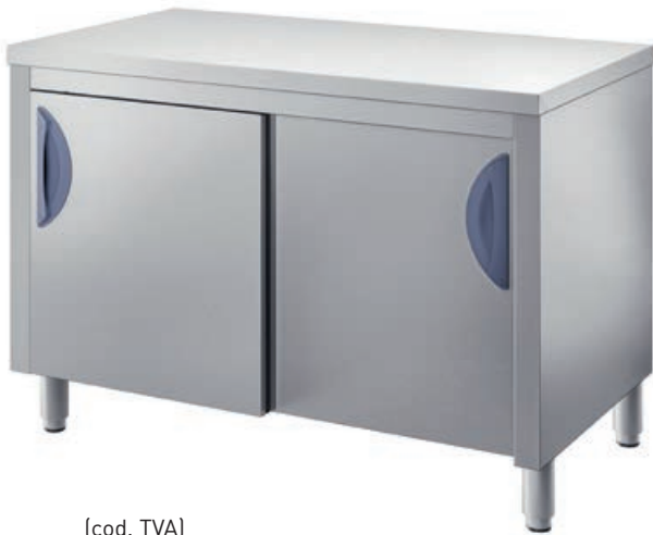
[cod. TVA] Tavolo armadiato. Cupboard table. Table armoire. Tisch mit Unterschrank.