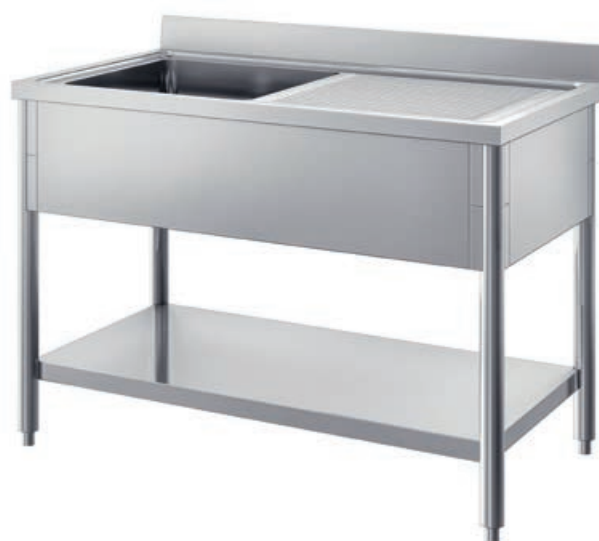
(cod. LO) Lavello su gambe in tubo tondo con ripiano inferiore. Sink unit on round tubular legs with bottom shelf. Plonge sur piètement tubulaire avec étagère basse. Spüle mit unterer Ablagefläche und Rohrbeinen.