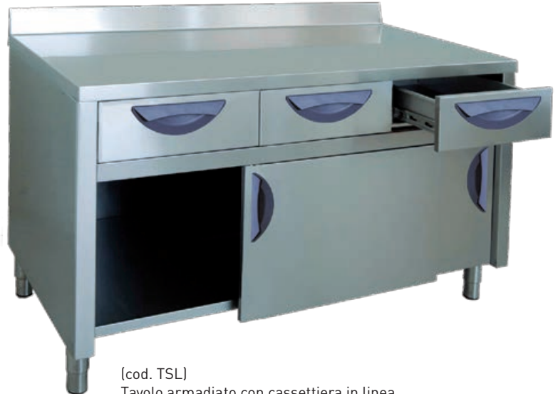
[cod. TSL] Tavolo armadiato con cassettera in linea. Cupboard table with drawers in line. Table armoire avec tiroirs à l'horizontale. Tisch mit Unterschrank mit Schubladen in einer Reihe.