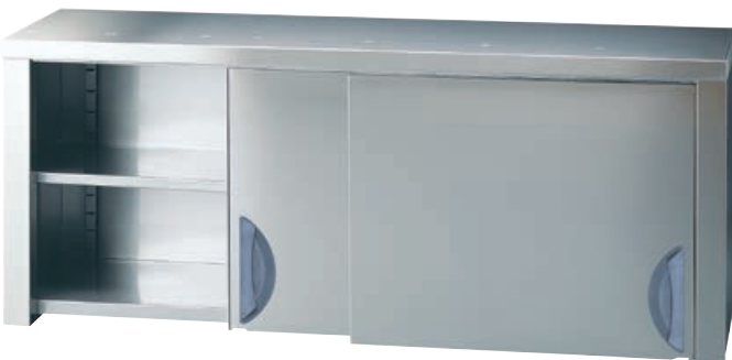
[cod. PS] Armadietto pensile con piani lisci. Overhead cupboard with smooth shelves. Placard étagères pleines. Hängeschrank mit glatten Flächen.