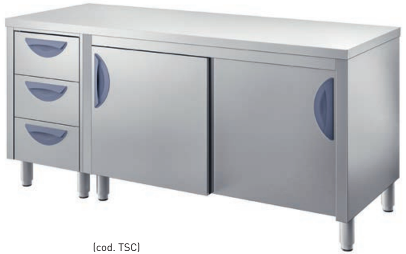
[cod. TSC] Tavolo armadiato con cassettera laterale. Cupboard table with side drawer unit. Table armoire avec tiroirs latéraux. Tisch mit Unterschrank mit seitlichem Schubladenfach.

Cabinet tables Les meubles bas Schranktische