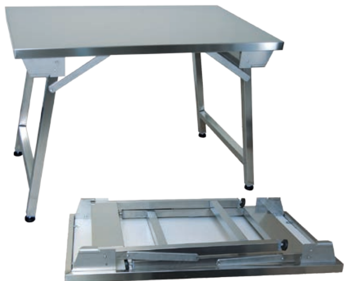
(cod. TVP) Tavolo inox su gambe pieghevoli. Ideale per tutti i tipi di manifestazioni, banchetti o buffet e per tutte le occasioni in cui è necessario smobilizzare velocemente una postazione. In pochi secondi può essere chiuso occupando un minimo ingombro.

Stainless steel table on folding legs. Ideal for all types of events, buffets or banquets and for all occasions and in which must demobilize quickly a workstation. In a few seconds can be closed occupying small size.