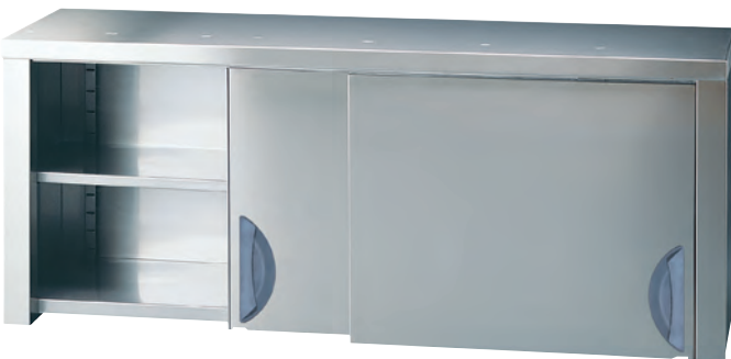
[cod. PS] Armadietto pensile con piani lisci. Overhead cupboard with smooth shelves. Placard étagères pleines. Hängeschrank mit glatten Flächen.