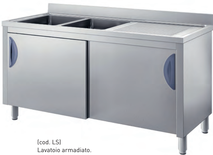
(cod. LS) Lavatoio armadiato. Sink cupboard. Meuble plonge. Spüle mit Unterschrank.