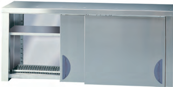
[cod. PP] Armadietto pensile scolapiatti. Overhead draining cupboard. Placard égouttoir. Hängeschrank Abtropfständer.