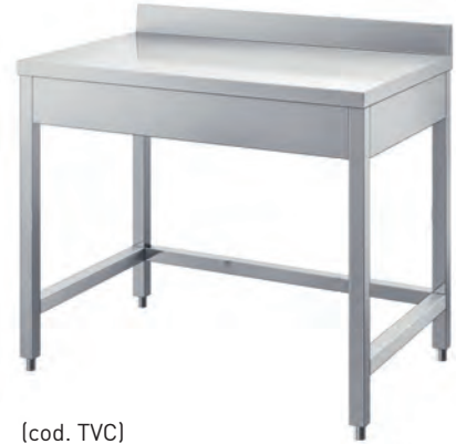
(cod. TVC) Tavolo con cornice. Table with frame. Table à rebords. Tisch mit Rahmen.