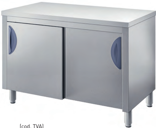
[cod. TVA] Tavolo armadiato. Cupboard table. Table armoire. Tisch mit Unterschrank.