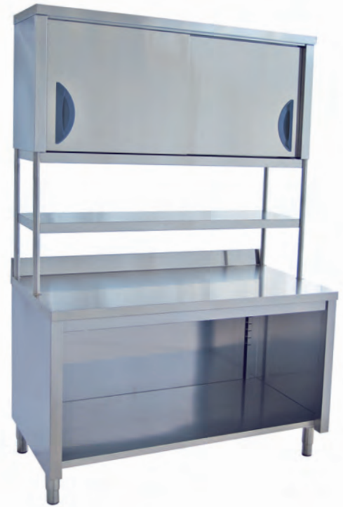
Tavolo armadiato a giorno (cod. TVS) con ripiani d'appoggio. (cod. RP) Open cupboard table with worktops. Table armoire ouverte avec étagères posées. Tisch mit Unterschrank, offen, und mit Ablageflächen.

REALIZZABILI SU MISURA! CAN BE MADE TO MEASURE! FABRICATION SUR MESURE POSSIBLE AUSFÜHRUNGEN NACH MASS!