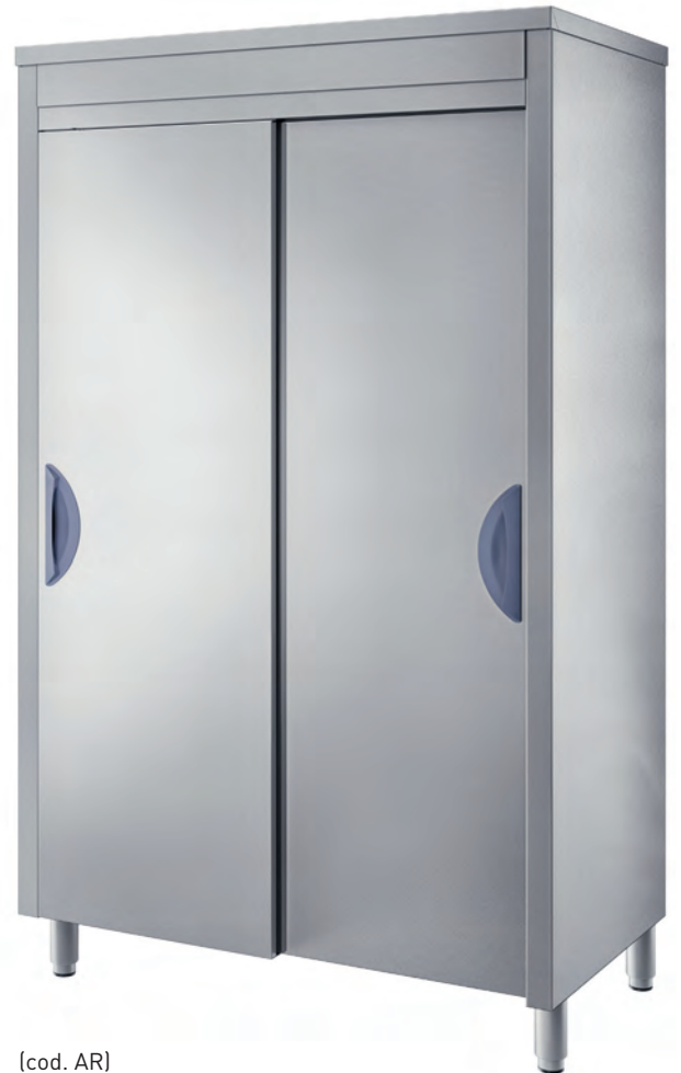
[cod. AR] Armadio di riposto. Storage cupboard. Armoire d'office. Ablageschrank.