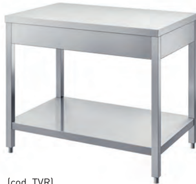
(cod. TVR) Tavolo con ripiano. Table with shelf. Table avec étagère. Tisch mit Ablagefläche.