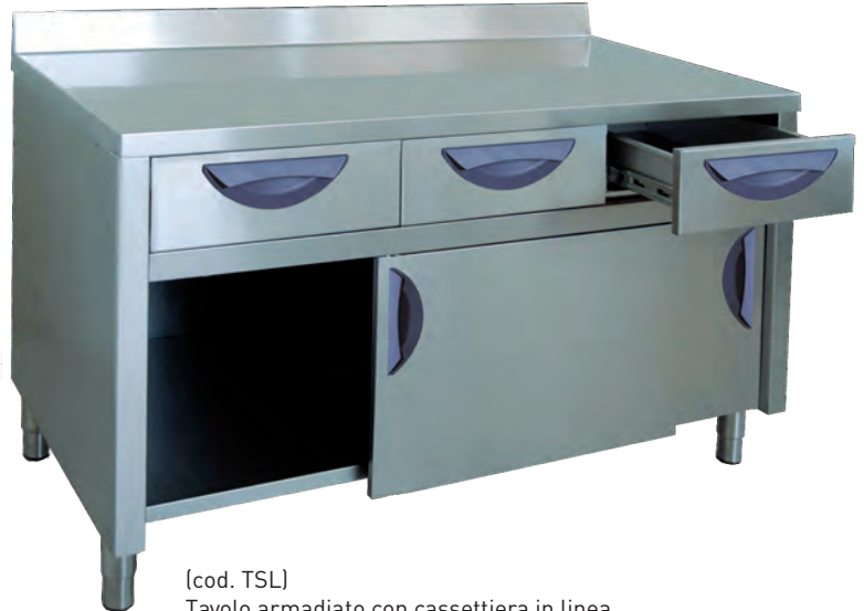
[cod. TSL] Tavolo armadiato con cassettera in linea. Cupboard table with drawers in line. Table armoire avec tiroirs à l'horizontale. Tisch mit Unterschrank mit Schubladen in einer Reihe.