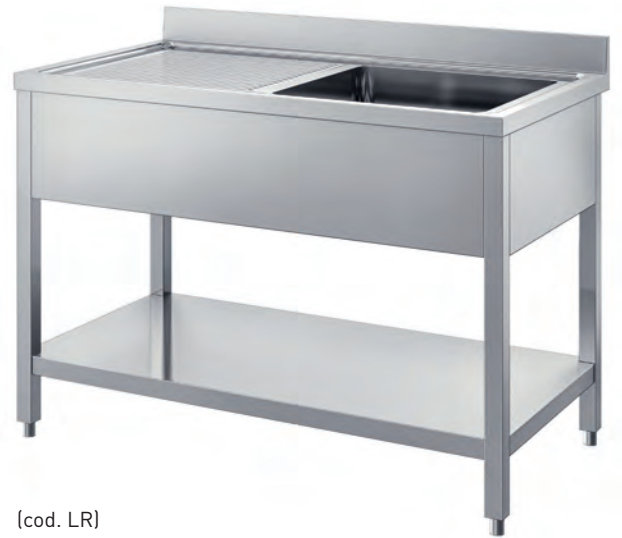
(cod. LR) Lavatoio con ripiano. Sink unit with shelf. Plonge avec étagère. Spüle mit Rahmen.