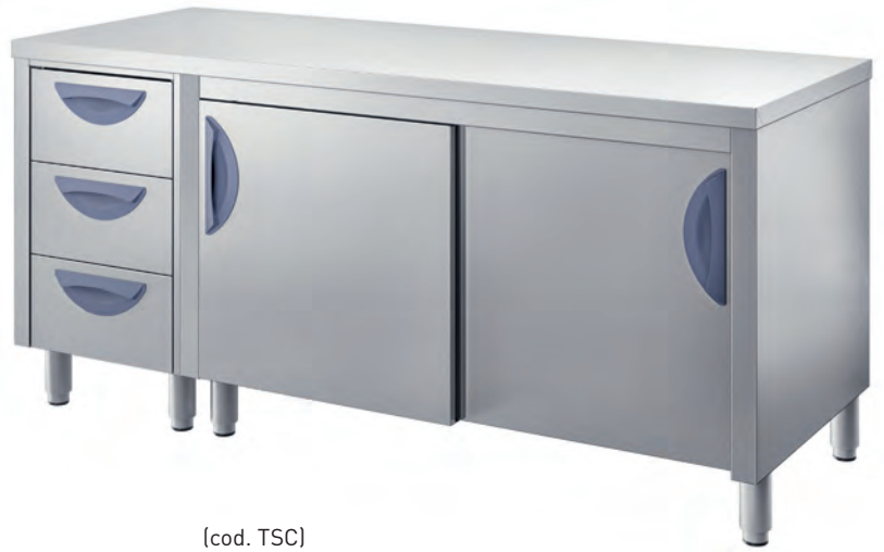
[cod. TSC] Tavolo armadiato con cassettera laterale. Cupboard table with side drawer unit. Table armoire avec tiroirs latéraux. Tisch mit Unterschrank mit seitlichem Schubladenfach.

Cabinet tables Les meubles bas Schranktische